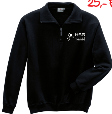
HAKRO- ZIP-Sweatshirt „unisex“ Wirkware aus 70 % Baumwolle und 30 % Polyester (300g/qm)