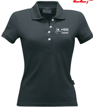
HAKRO- Woman-Polo „stretch“ Stretch-Piqué aus 94 % Baumwolle 6% Elasthan (190 g/qm)