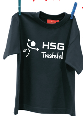
HAKRO- Kids-T-Shirt „classic“ Single Jersey aus 100 % Baumwolle (160 g/qm)