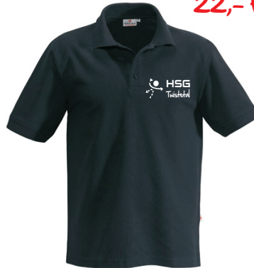
HAKRO- Top-Polo „unisex“ Piqué aus 100 % Baumwolle (200 g/qm)