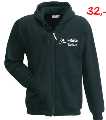
HAKRO- Kapuzen-Jacke Wirkware aus 70 % Baumwolle und 30 % Polyester (300g/qm)